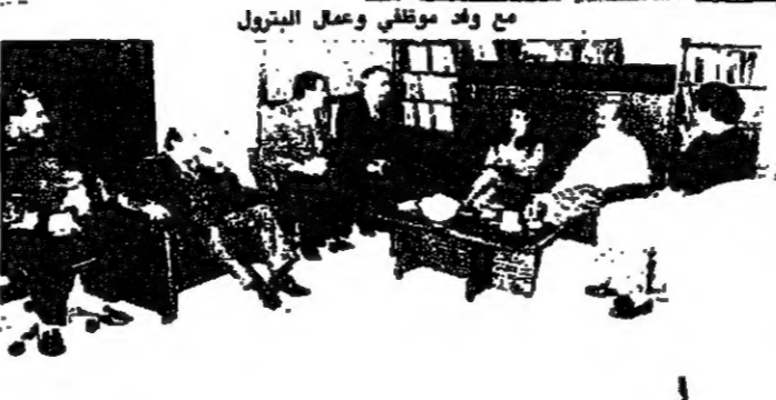
مع وفد موظفي وعمل البترول